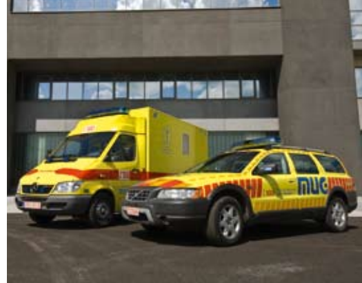
De nieuwe spoedgevallendienst

Ruim vier jaar geleden werd het ontwerp van de nieuwe spoedgevallendienst opgemaakt. Yves Platteeuw : "Zoals voor de meeste diensten