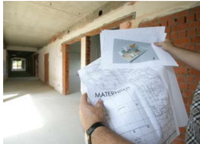
Verbouwing van de materniteit

De renovatiewerken zullen een tweetal jaar in beslag