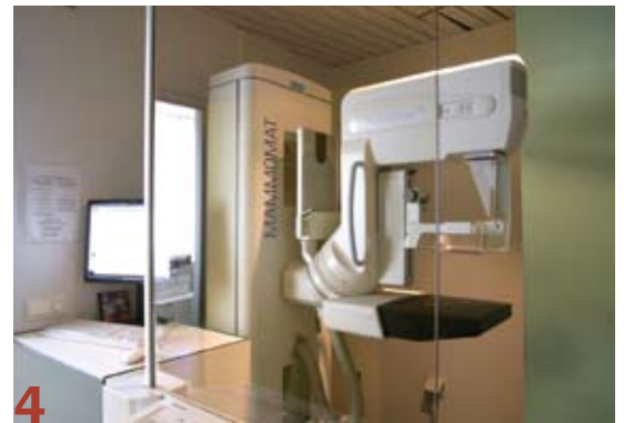
Foto 4: Met het gloednieuwe, direct digitale mammografietoestel in de Klaverstraat kan het mammogram op zeer grote beeldschermen worden afgebeeld. Het contrast is tot vier maal groter, de borst kan uitvergroet worden en de vergelijking met vorige onderzoeken is eenvoudiger.

Foto 3: Op de nieuwe radiologiestek zijn twee nieuwe digitale zalen voorzien. Filmplaten behoren weldra tot het verleden: alle beelden die gemaakt worden, gaan rechtstreeks naar de computer en van daar naar de specialist en de huisarts.