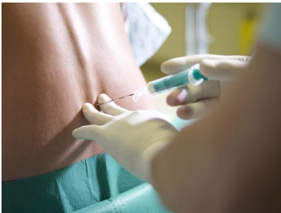
plaatsing van de epidurale naald

Vervolgens wordt een katheter geschoven doorheen de epidurale naald, tot in de epidurale ruimte (ruimte tussen de harde vliezen en de wervels).