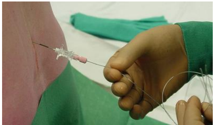
epidurale katheter door de epidurale naald

De naald wordt daarna verwijderd en de katheter wordt tegen de rug vastgekleefd met pleisters. Gedurende de arbeid en de bevalling worden de verdovingsmiddelen via dit buisje toegediend. De patiënt kan dit zelf controleren (via de PCEA (Patient controlled epidural analgesia), zie hieronder).