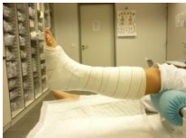
open gips spalk gipsgoot