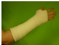
gesloten gips volledig gipsverband circulair gips

In de acute fase, kort na het ongeval, of bij fors gezwollen ledematen wordt een open gips aangelegd. Open gipsen geven minder steun dan volledige gipsverbanden, maar ze laten beter een zwelling toe en voorkomen druk en spanning in het gipsverband. Na het verdwijnen van de zwelling zal een open gips meestal door een gesloten gips vervangen worden. Dit gips dient steeds comfortabel te zitten (niet te vast, niet te los).